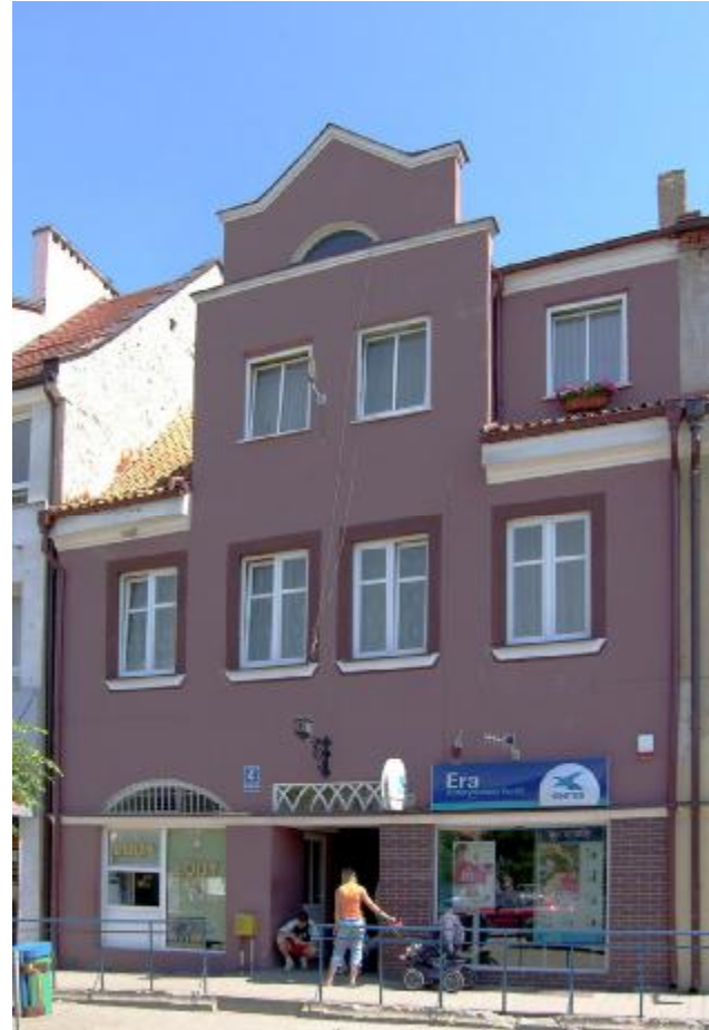
Widok ogólny elewacji