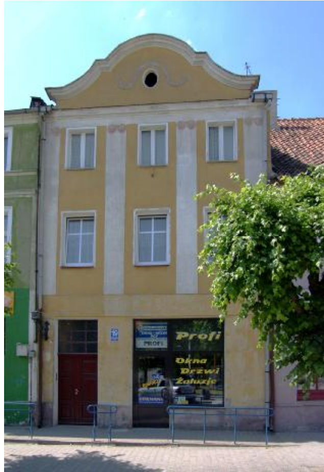
Widok ogólny elewacji

11. Historia: Działdowo lokowane na prawie chełmińskim 14.VIII.1344r.; dogodne położenie implikowało dobre kontakty handlowe; niszczone w czasie kolejnych pożarów i wojen. Po pożarze w 1733r. odbudowane wg planu J.L.Schultheiss von Vhfriedt; po pożarze w 1794r. plan odbudowy opracował mierniczy Tite i radca wojskowy Schimmelpfennig a obecny kształt centrum miasta jest efektem tej realizacji. W końcu XIX w. autorem większości realizacji był A.Stohr i skromniejszy A.Goerke. Po zniszczeniach I WŚ architektoniczne wytyczne odbudowy nadał H.Muthesius. Po 1915r. odbudowywano wg planu P.Kahma. Obecny Plac Mickiewicza to dawny rynek wytyczony w 1344r.