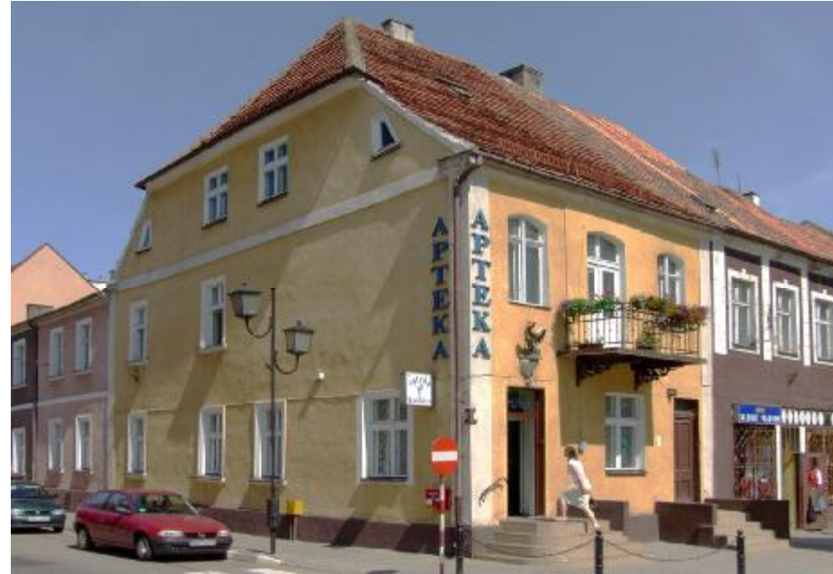
Widok ogólny elewacji

5. Obręb: Działdowo nr ewid. gr.: 1113/9