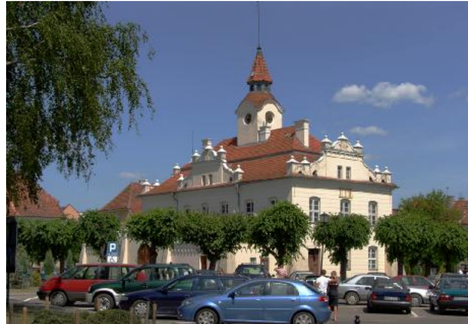
Widok ogólny elewacji

4. Adres: Plac Adama Mickiewicza 43; 13-200 Działdowo