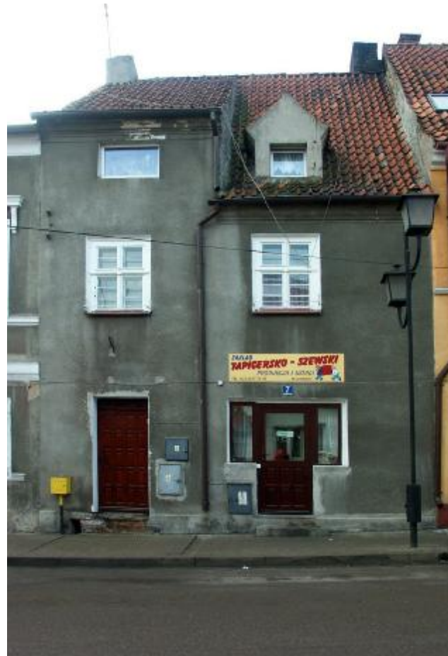
Widok ogólny elewacji