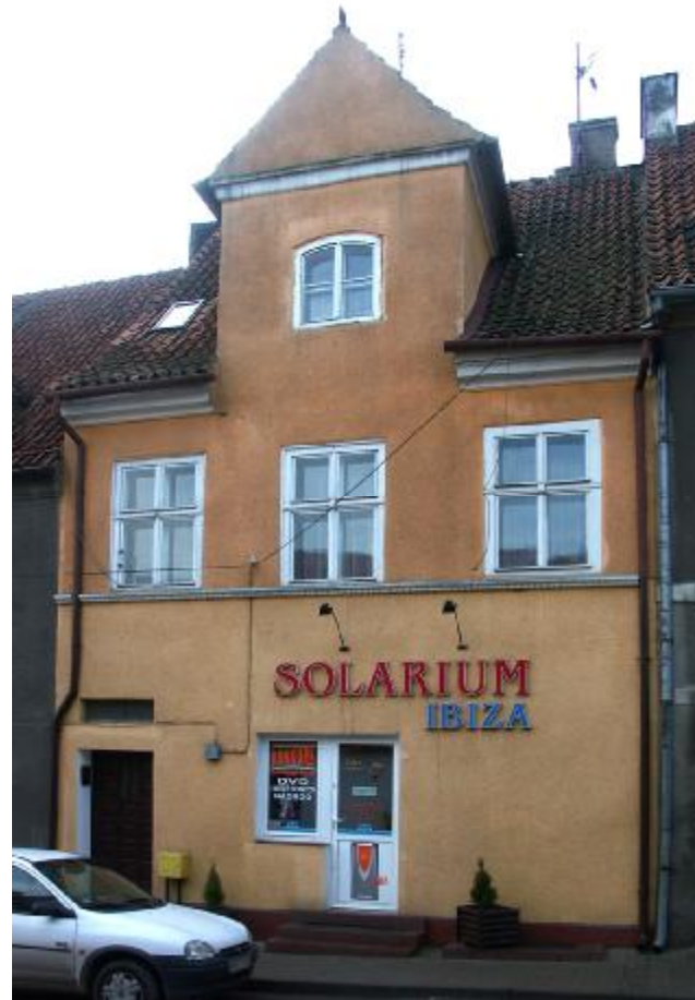
Widok ogólny elewacji