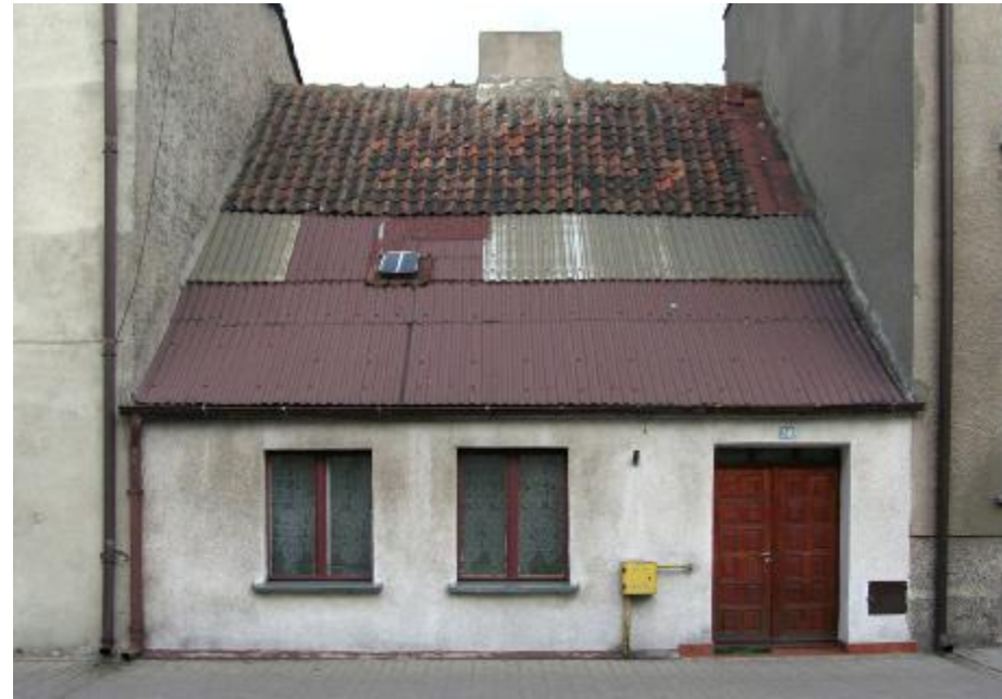
Widok ogólny elewacji

4. Adres: ul. Katarzyny 38; 13-200 Działdowo