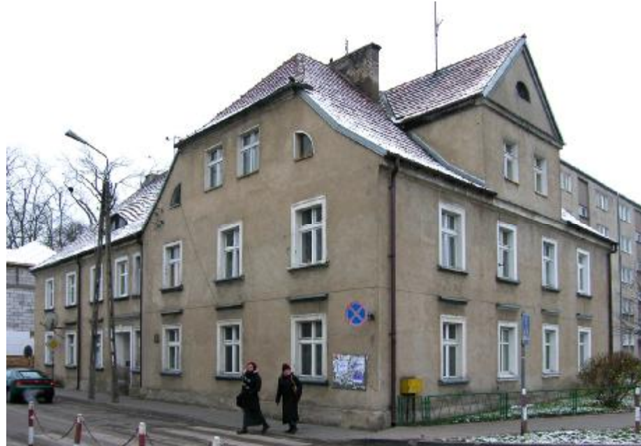
Widok ogólny elewacji

4. Adres: Ul. Księżodworska 2; 13-200 Działdowo