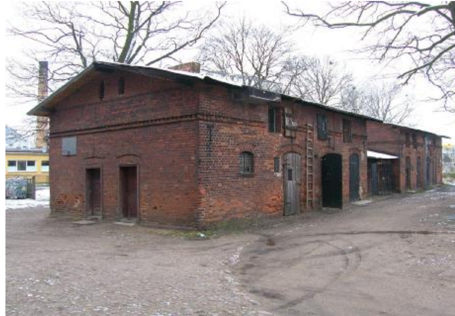
Widok ogólny elewacji

4. Adres: ul. Lidzbarska 1; 13-200 Działdowo