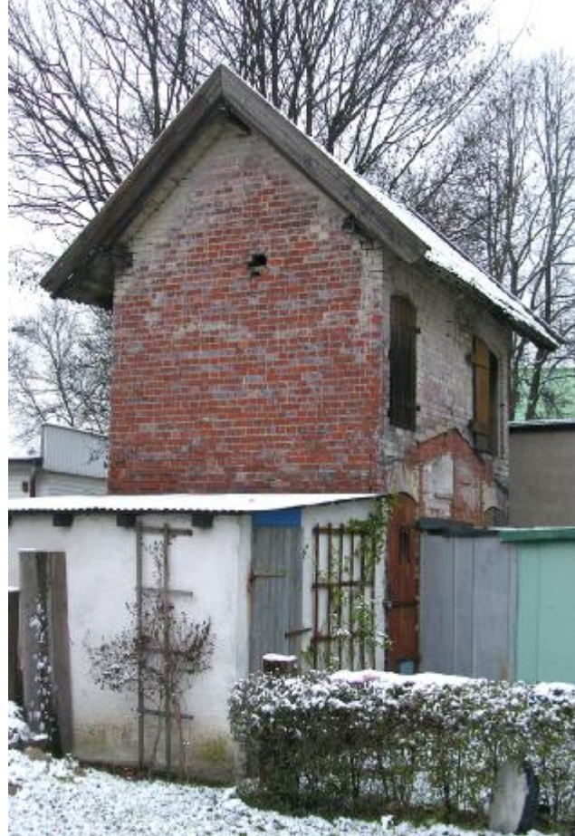
Widok ogólny elewacji

4. Adres: ul. Lidzbarska 2; 13-200 Działdowo