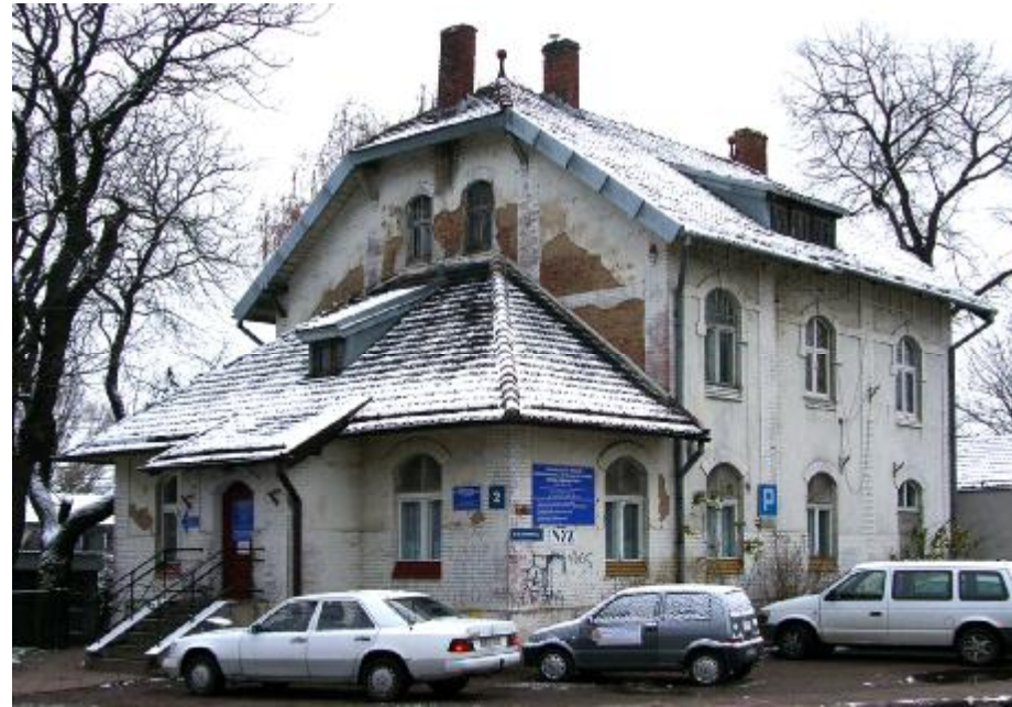
Widok ogólny elewacji

4. Adres: ul. Lidzbarska 2; 13-200 Działdowo