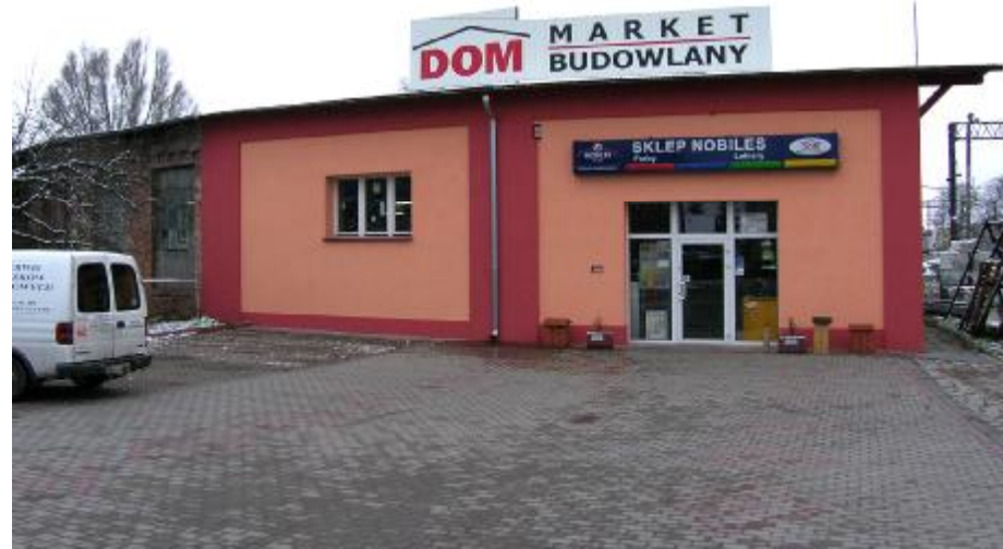
Widok ogólny elewacji