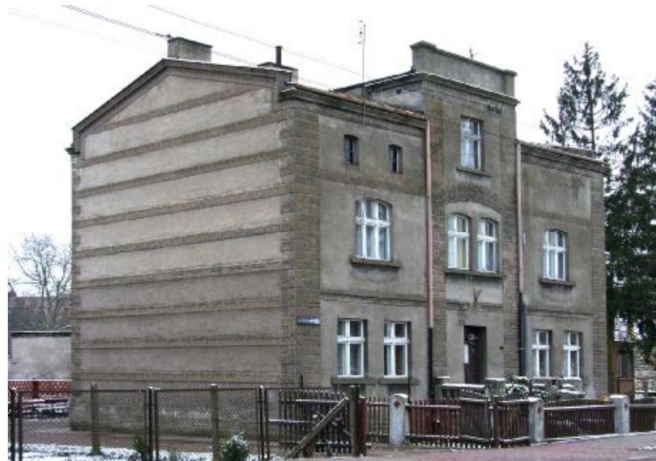
Widok ogólny elewacji

4. Adres: ul. Lidzbarska 21; 13-200 Działdowo