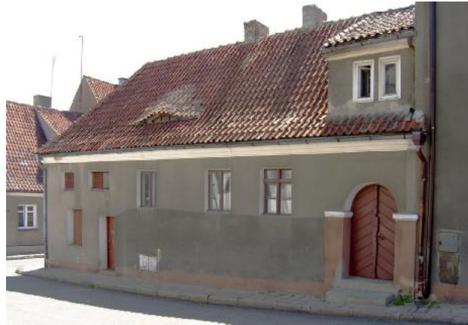
Widok ogólny elewacji

11. Historia: Działdowo lokowane na prawie chełmińskim 14.VIII.1344r.; dogodne położenie implikowało dobre kontakty handlowe; niszczone w czasie kolejnych pożarów i wojen. Po pożarze w 1733r. odbudowane wg planu J.L.Schultheiss von Vhfriedt; po pożarze w 1794r. plan odbudowy opracował mierniczy Tite i radca wojskowy Schimmelpfennig a obecny kształt centrum miasta jest efektem tej realizacji. W końcu XIX w. autorem większości realizacji był A.Stohr i skromniejszy A.Goerke. Po zniszczeniach I WŚ architektoniczne wytyczne odbudowy nadał H.Muthesius. Po 1915r. odbudowywano wg planu P.Kahma. Okolica ul.Młyńskiej to najstarsza cz. miasta, dawna osada rybacka.