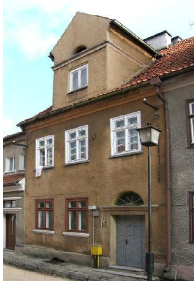
Widok ogólny elewacji