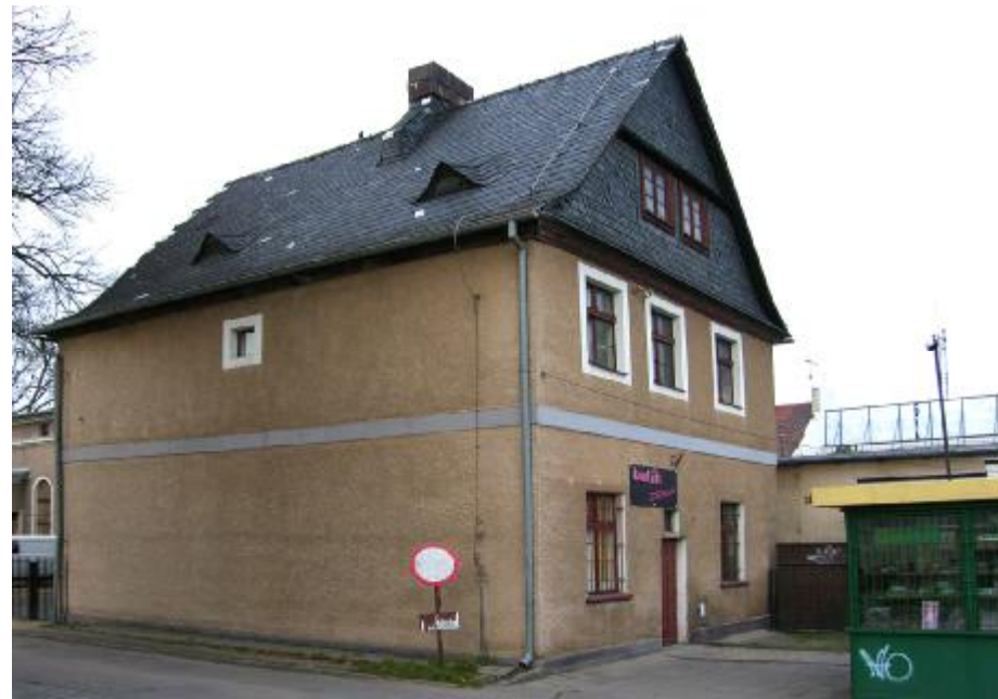
Widok ogólny elewacji

4. Adres: ul. Pocztowa 11; 13-200 Działdowo