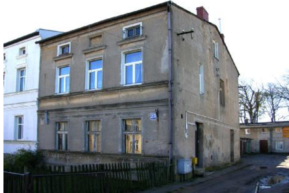
Widok ogólny elewacji