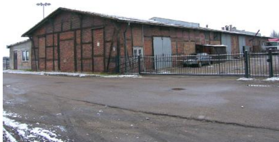
Widok ogólny elewacji

6. Sposób użytkowania / funkcja obecna: usługowy