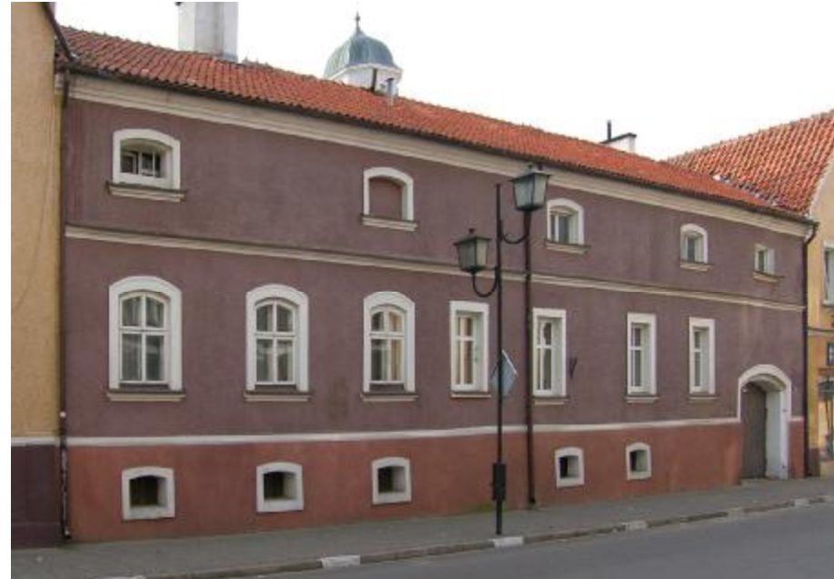
Widok ogólny elewacji