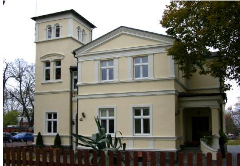
Widok ogólny elewacji

4. Adres: ul. Władysława Jagiełły 42; 13-200 Działdowo