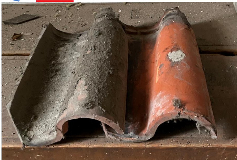
Fot. 2. - Oryginalna dachówka z lat 30. XX wieku – widok od góry.