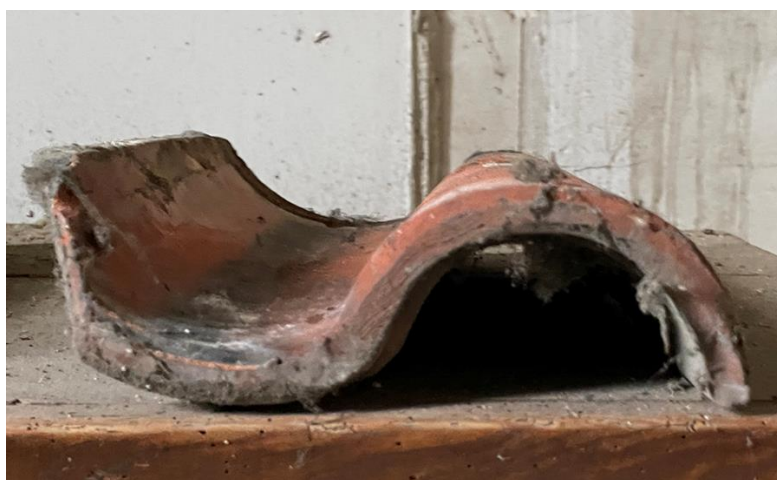
Fot. 1. – Oryginalna dachówka z lat 30. XX wieku – widok od czoła.