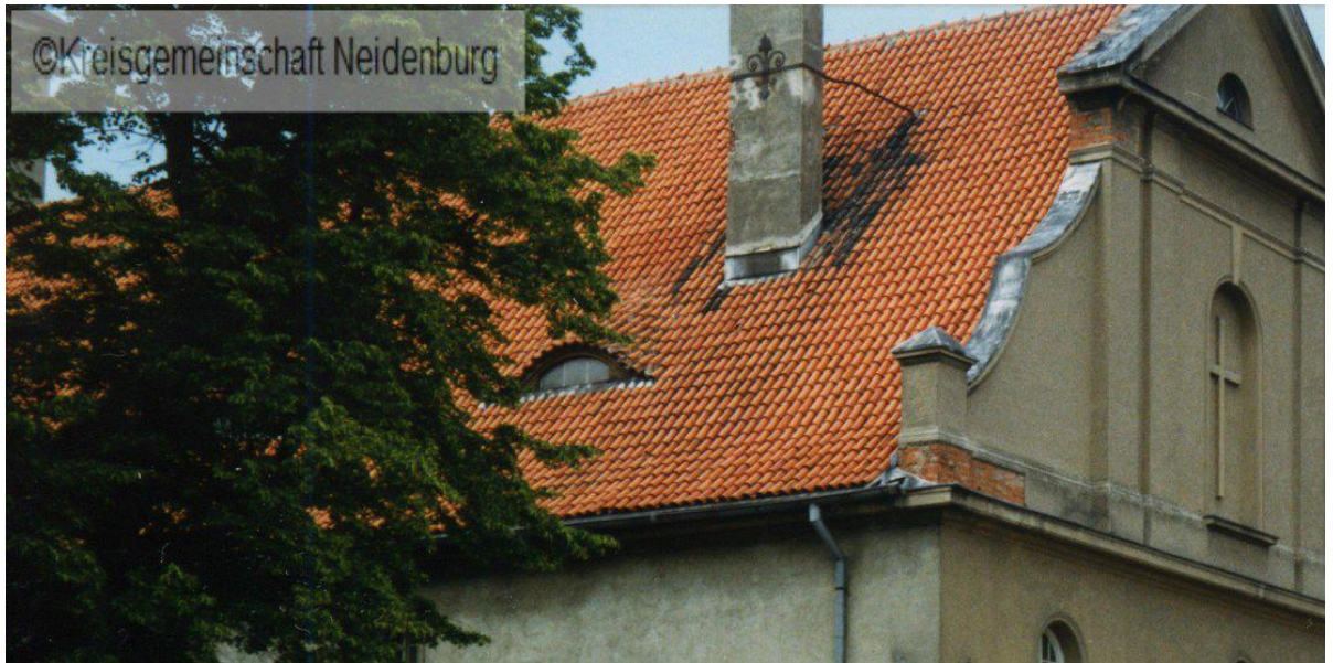
Fot. 5. – Oryginalne pokrycie dachu – stan z pocz. lat 90. XX wieku.