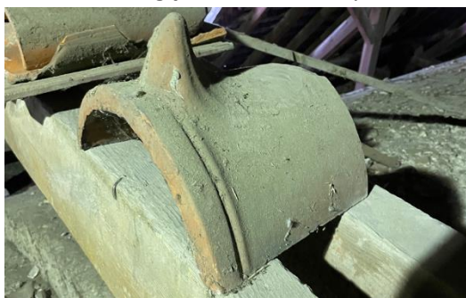
Fot. 4. – Fragment oryginalnego gąsiora z lat 30. XX wieku.

Gąsiory tak jak dachówka powinny być nieglazurowane o barwie jasnopomarańczowej. Przekrój gąsiora powinien odpowiadać historycznemu półokrągłemu. Dopuszcza się również zastosowanie gąsiorów z ozdobnym noskiem (fot. 4).