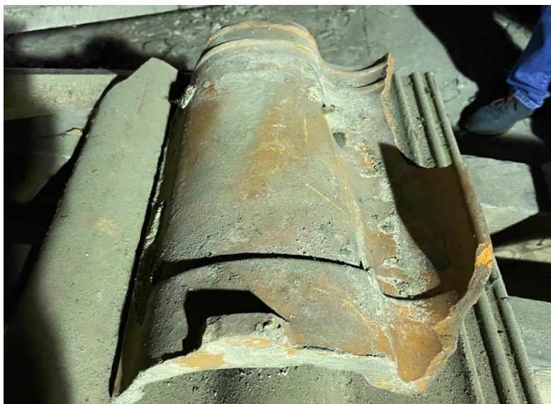
Fot. 3. - Oryginalna dachówka z lat 30. XX wieku – widok od spodu.