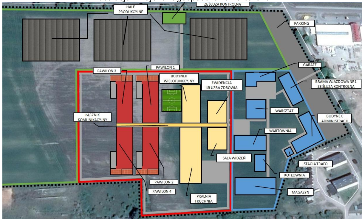
Ilustracja. Projekt zagospodarowania terenu.

Na etapie opracowywania projektu planu miejscowego nie określa się jaki rodzaj produkcji i usług realizowany będzie na przedmiotowym terenie, a jedynie wskazuje możliwe kierunki rozwoju zabudowy.